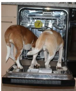
Ich helf Dir auch beim Abwasch..