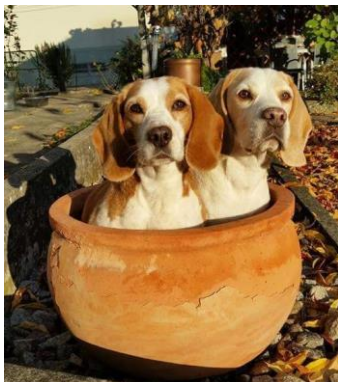
Jetzt simmer z friede mit dir