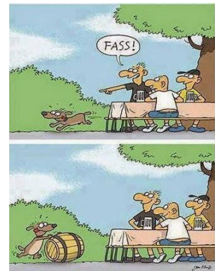
Lueg, wie'n er folged

Liebe Beagle Freunde, jetzt ist es Zeit , dass wir uns wieder einmal persönlich treffen.