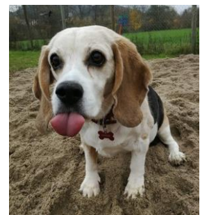
Oh Läck doch mir am Tschöpli