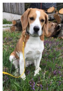
Habe ich verdient Oder?