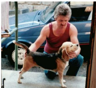
Lady Cherry mit Sepp

Als Zuchthündin sollte sie bei uns nochmals einen Wurf machen, das war Bedingung zur Übergabe von «Lady Cherry, The Happiness of Sommer», Stammutter unserer «Kids of Leibstadt».