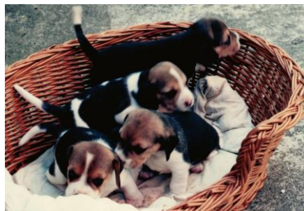
Ein Körbchen voller Glück