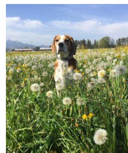
Wer kann mir schon Böse sein?