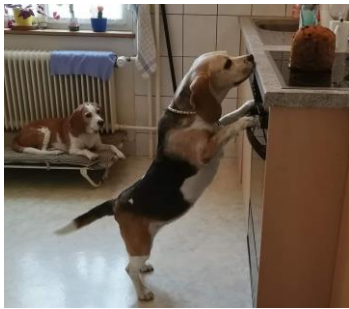
Mmh was riecht denn da?