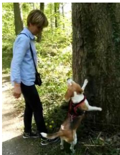
«Gaaanz ufe»..... Eure Ginger