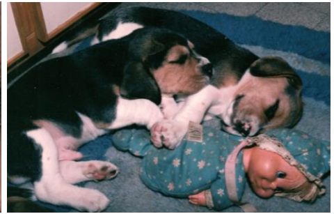
Pic-Nic mit Welpen